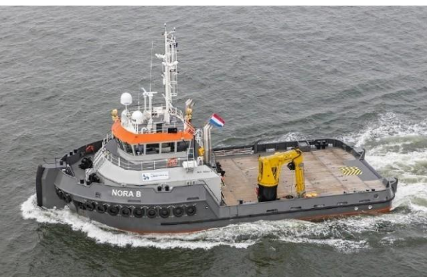
« NORA B »