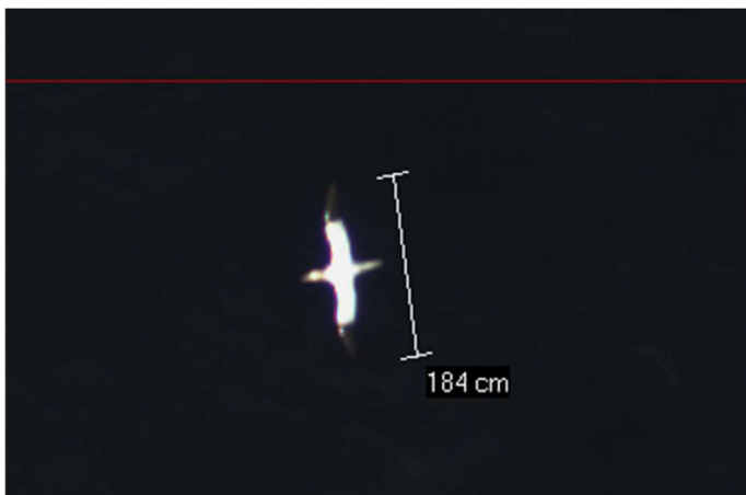
Fou de Bassan

Les images pointées comme nécessitant une analyse plus poussée sont transmises à des ornithologues marins expérimentés, dont la plupart travaillent avec HiDef depuis plusieurs années et ont été formés à l'analyse d'images vidéo haute définition d'oiseaux, de mammifères marins et d'autres vertébrés. Les images peuvent être analysées à l'aide d'un logiciel pour améliorer leur aspect (lumière/contrastes etc.) et faciliter l'identification de l'objet. Dans le cadre de la présente mission, les experts naturalistes identifieront si possible au niveau de l'espèce et enregistreront toute autre information disponible (comportement, direction du vol ou de la nage, sexe, âge, etc.).