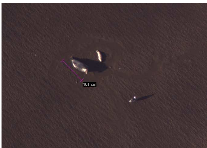
Phoque gris

Pour tous les mammifères marins et autres pélagiques identifiés, leur comportement est également noté, qu'ils se produisent à la surface ou en subsurface, ainsi que la direction de déplacement entre la première et la dernière image dans laquelle ils apparaissent.