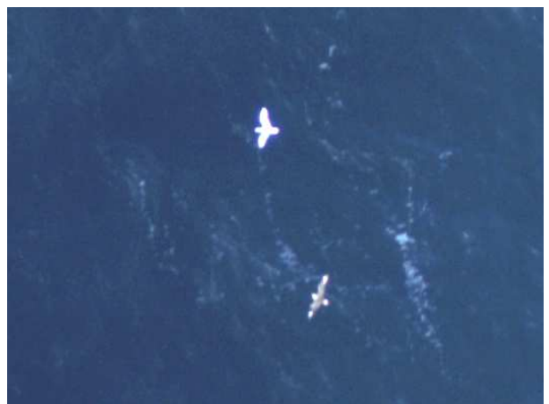
Mouette tridactyle et Labbe parasite

Pour tous les mammifères marins et autres pélagiques identifiés, leur comportement est également noté, qu'ils se produisent à la surface ou en subsurface, ainsi que la direction de déplacement entre la première et la dernière image dans laquelle ils apparaissent.