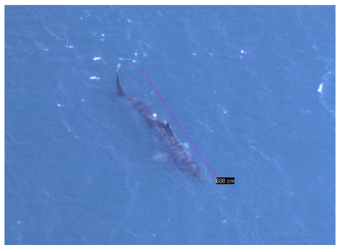
Requin pélerin