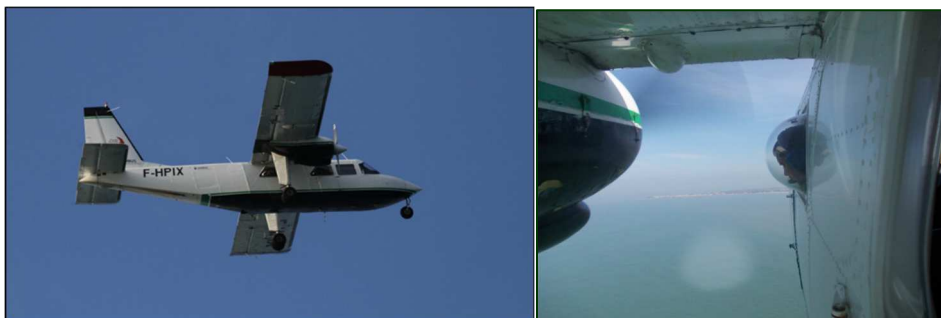
Britten-Norman Islander (BN2) équipé de hublots bulle (Biotope)

L'avion envisagé est un Britten-Norman 2, avion particulièrement adapté aux expertises visuelles avec 3 observateurs (6 places, ailes hautes), équipé de hublots-bulle, permettant une observation à la verticale du transect.