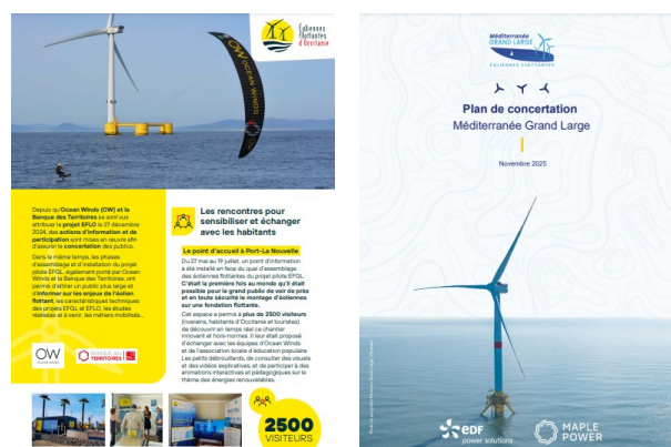
Plans de concertation des projets EFLO et MGL

Le dialogue avec les pêcheurs, les élus, les associations et les habitants se poursuit après la désignation des lauréats. Réunions publiques, ateliers participatifs, débats... Cette concertation, menée sous l'égide des garants de la CNDP, permet d'adapter les projets et de répondre aux préoccupations locales. Les lauréats de l'AO6 ont établi des plannings de concertation disponibles sur les sites internet dédiés au projet EFLO (parc de la Narbonnaise-Sud-Hérault) et au projet MGL (parc au large du golfe de Fos).