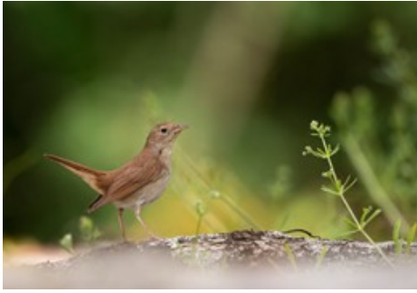
Crédit photo : Rossignol philomèle, Luscinia megarhynchos - Phil Léger